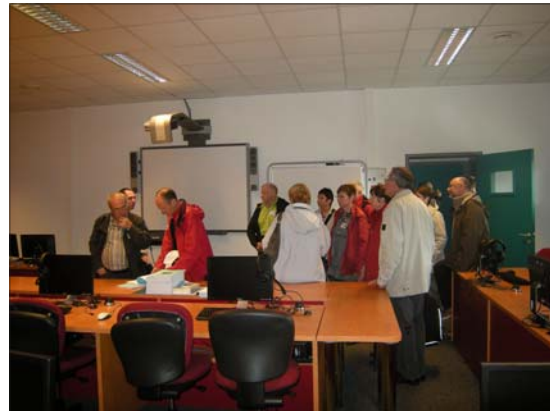
Visite des ateliers à l'ENIB.