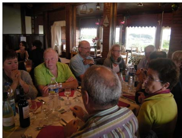
La promotion 1972 s'était réunie pour célébrer leur 40 ans de sortie de l'ENIB.