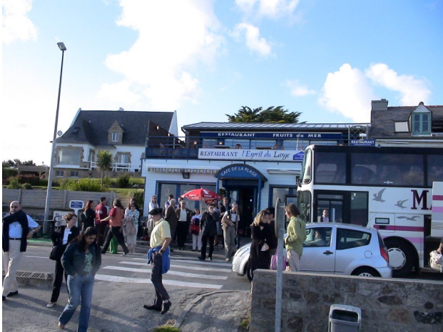
Le groupe à l'arrivée au restaurant « l'Esprit du Large ».