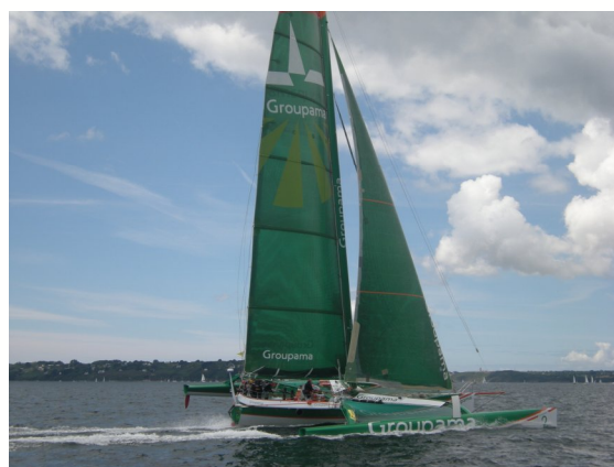
Quel plaisir de naviguer parmi ces voiliers !