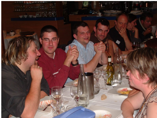
La promo 1998