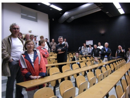
Ci-dessus l'amphi « Stiff »

Un grand merci à ces bonnes volontés qui ont bien voulu consacrer quelques heures de leur week-end à ces retrouvailles.