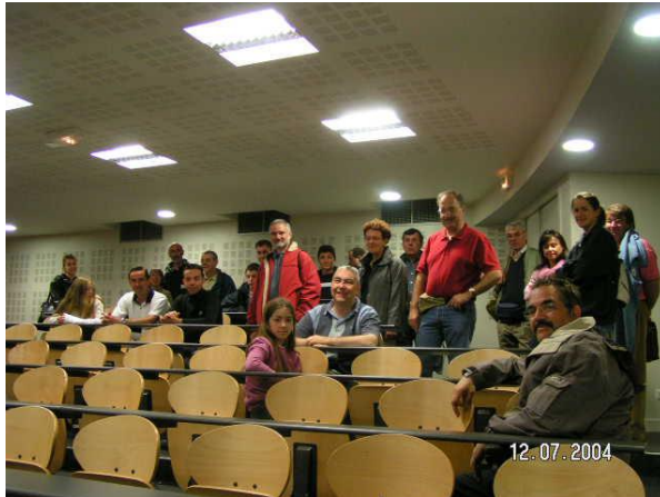
Le nouvel amphithéâtre Kéréon